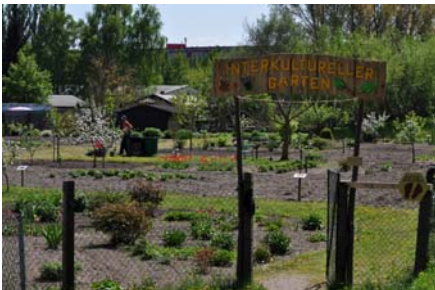
Foto: So wie hier im Interkulturellen Garten Neubrandenburg soll es in Güstrow auch mal aussehen ...